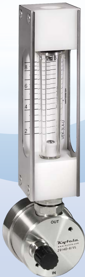
Malli 2914 varustettuna mallin VL virtausmittarilla

KYTOLA® vakiovirtaussäädin Malli 2914 on tarkoitettu keskisuurten nestevirtausten asetteluun soveluksissa, joissa tulo- tai vastapaine vaihtelee.