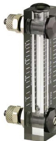
Altura ~94 mm