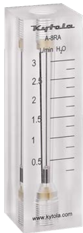
Altura 130 mm