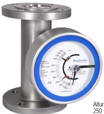
Altura 250 mm