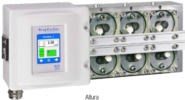
Altura 140 mm