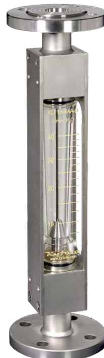
Altura 406 mm