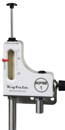
Altura ~272 mm máx.