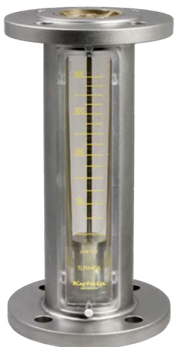
Altura 317 mm