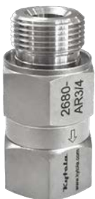
Altura 46–70 mm