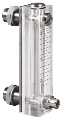
Altura 132 mm