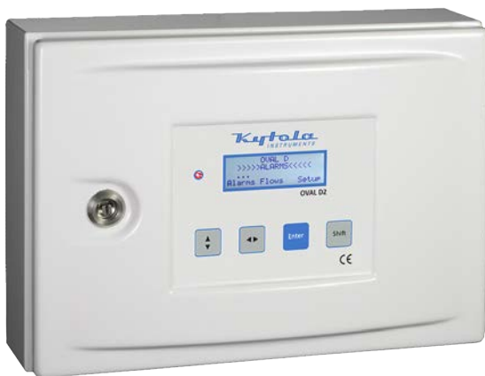
Altura 250 mm