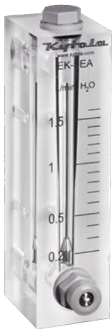
Altura 128 mm