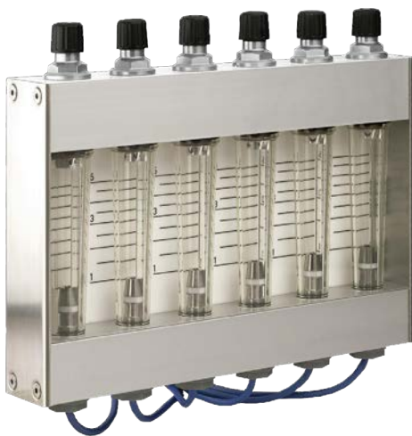
Altura ~263 mm máx.