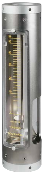
Altura 373 mm