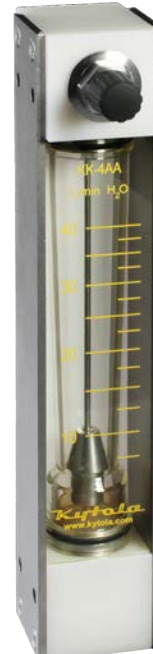
Altura 310 mm