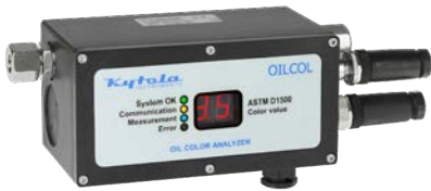
Altura 90 mm