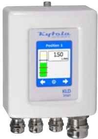
Altura 120 mm