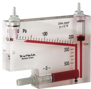
Altura 137 mm