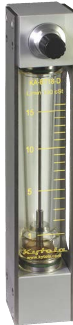
Altura 310 mm