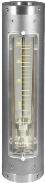
Altura 373 mm