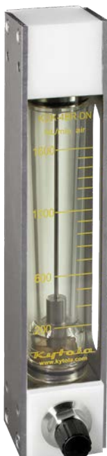
Altura 310 mm