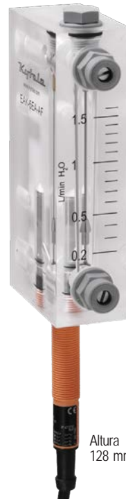
Altura 128 mm