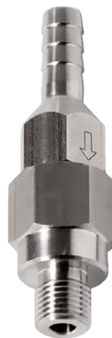
Altura 59–81 mm