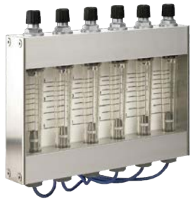
Altura ~255 mm