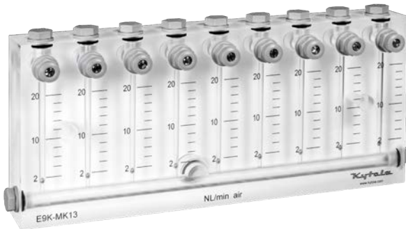
Altura 128 mm