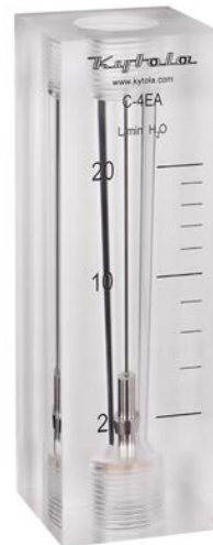
Altura 165 mm