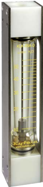
Altura 310 mm