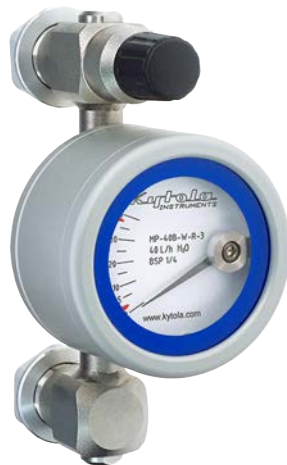
Altura 145 mm