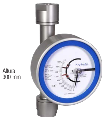
Altura 300 mm