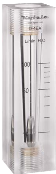
Altura 210 mm