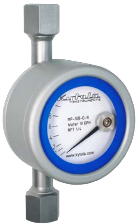
Altura 140 mm